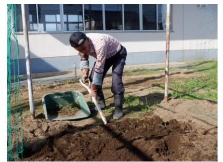
日頃から校庭・農園・花壇の整備等を行ってくださっています。