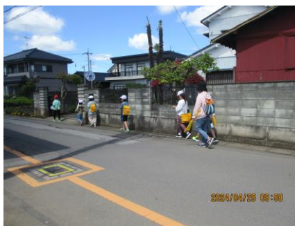
3年生 校外学習では安全確保のために見守りをさせていただきました。

今年度も、様々な活動の中で学校のために支援ボランティアの方がご協力くださっています。今後も、機会ごとにお声を掛けますので、可能な方はご支援へのご協力をよろしくお願いいたします。